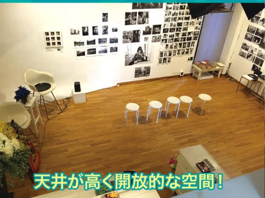
天井が高く開放的な空間!