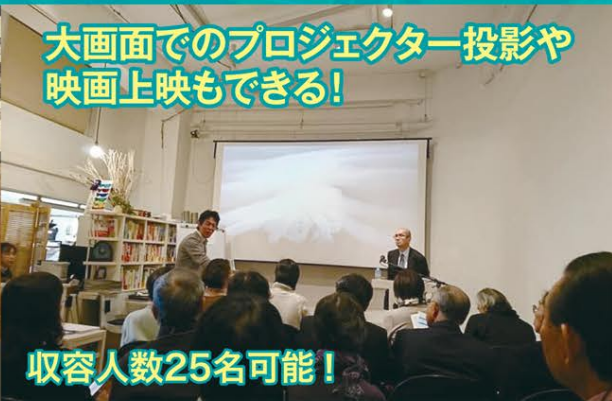
大画面でのプロジェクター投影や 映画上映もできる!